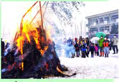
書初めを焼いたり。 するめやちくわも焼くよ!