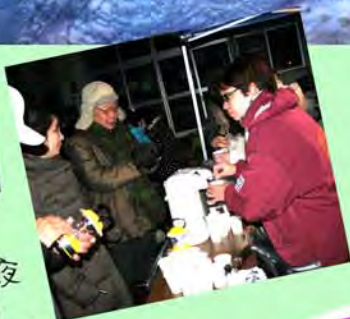
寒い夜 甘酒 サービス♡