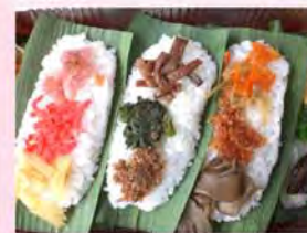
笹寿司 77のお好みの具はどれ?