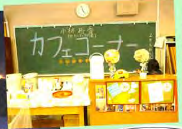
カフェコーナー Jr.ボランティアの