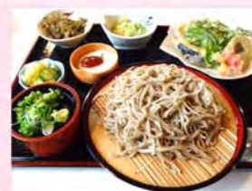
自慢のそばと、 山の幸たっぷりのメニュー

手打ちの自然薯そば、笹寿司、山菜や旬野菜のお惣菜... 郷土色豊かで、ぜいたくなごちそう。時には可憐なお花までが 一品に! その時季ならではの味わいが楽しめます。 きっと季節が変わるたびに足を運びたいくなる、そんなお店です。