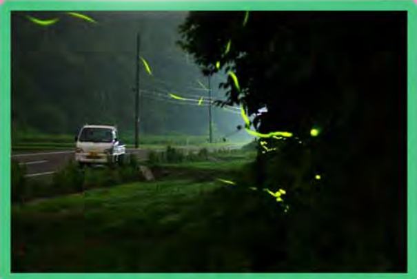
物出 諏訪橋 付近

上南地区の あちらこちらで ホタルが見られ ます。ホタル 日没、約1時間後 から光りますとぞす ので、夕刻のお散 歩にいかがですか? 見頃は20時頃です。