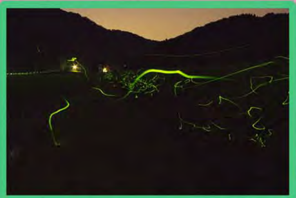
溝尾〜川詰 南能生小学校ウラから 川詰方面を眺む